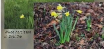
Wilde narcissen in Drenthe