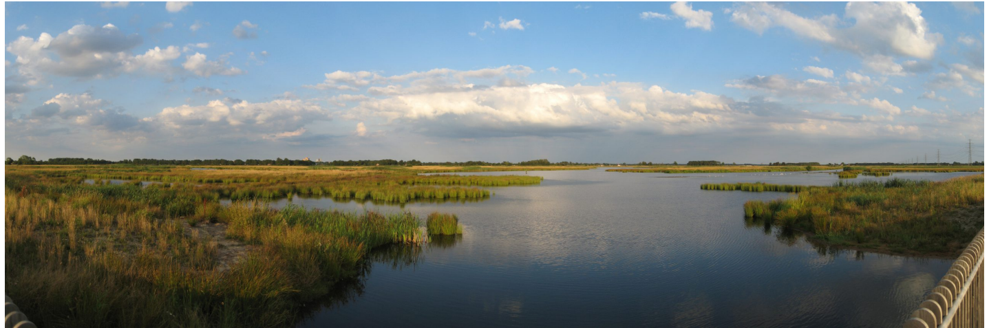
Blaauwvennen