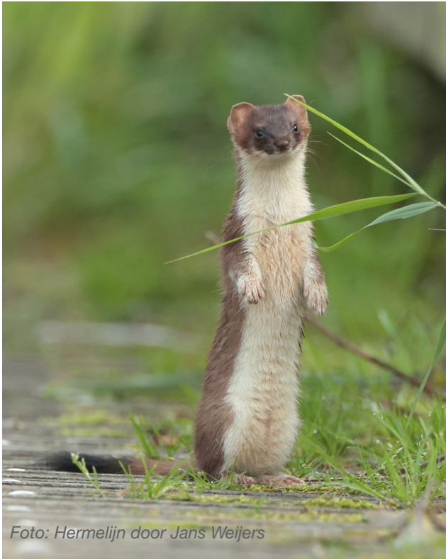
Hermelijn

Zo willen we het enthousiasme aanwakkeren voor dit prachtige gebied.