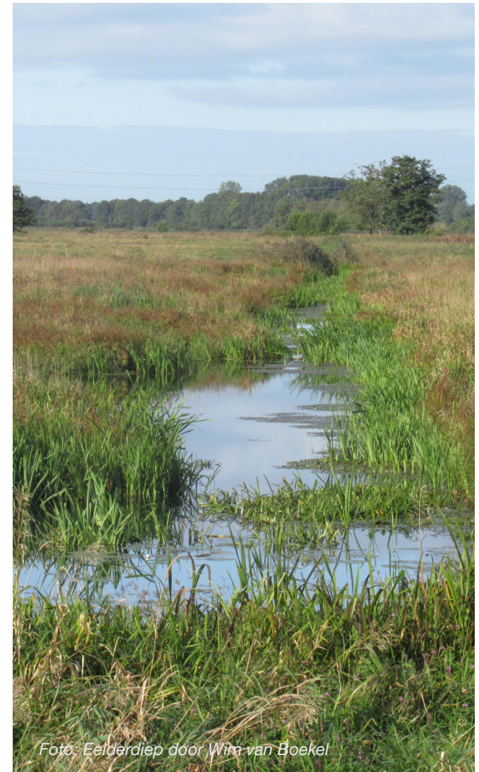
Foto: Eelderdiep